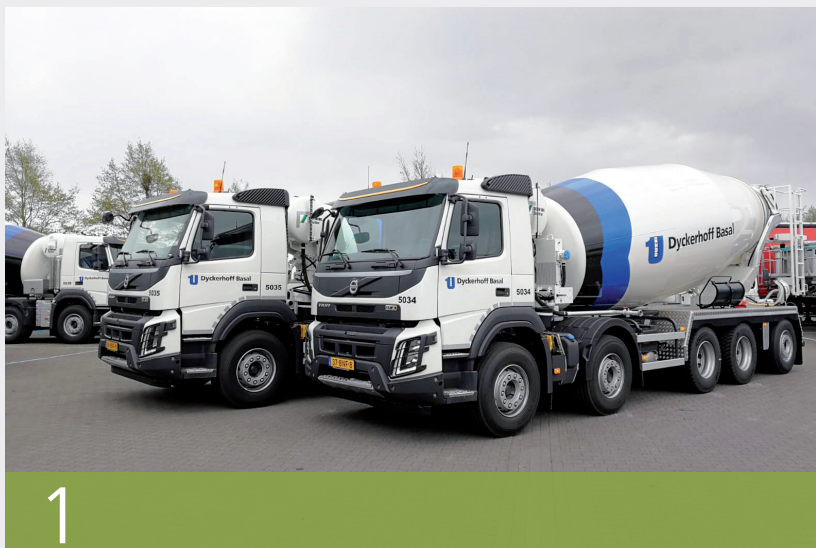
1. LE NUOVE BETONIERE A CINQUE ASSI VOLVO DA 15 M 3 / THE NEW 5-AXLE, 15 M 3 VOLVO MIXER TRUCKS

These new contracts will be managed concurrently with another of our major ongoing projects in the Netherlands to supply 300,000 m 3 of concrete for the "De Zeesluis in IJmuiden", a sea lock scheduled for completion by 2020.